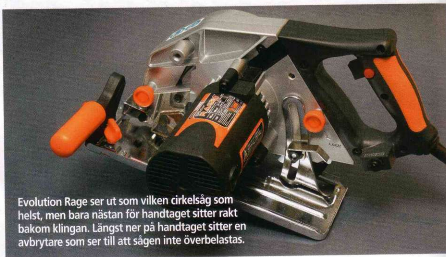
Evolution Rage ser ut som vilken cirkelsåg som helst, men bara nästan för handtaget sitter rakt bakom klingan. Längst ner på handtaget sitter en avbrytare som ser till att sågen inte överbelastas.

Spänning/effekt: 230 V/1 050 W Varvtal: 3 500 v/m Klinga: 185 mm (2 mm tjock) Hål i klingan: 20 mm Sågdjup (90/45 grader): 54/35 mm Vikt: 5,5 kg Tillbehör: Adapter till dammsugare, öronproppar och skyddsglasögon Prisbild: 2 000 kr (klingan kostar 350 kr)