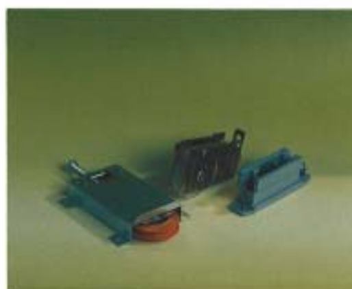
Hjulhus justerbara i höjled. Användes till skjutdörrar och fönster. Inom eller utomhus.