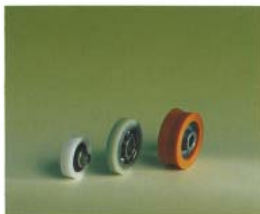
Olika material t ex Delrin, Nylon, med eller utan glasfyllnad. För att reducera ljud kan även mjukare plaster väljas, t ex Polyuretan.