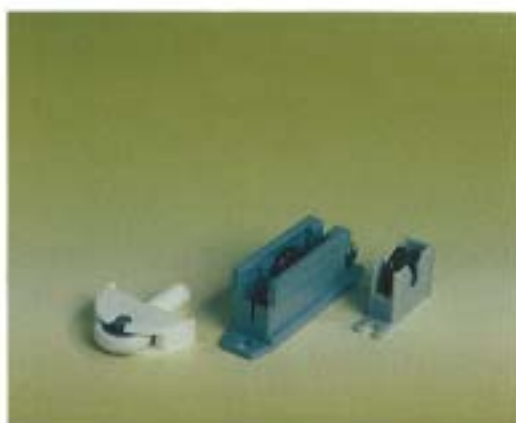
Kundanpassade hjulhus. Underlättar montering.