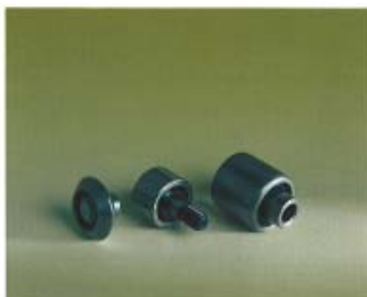
Stålytterbanor där bärigheten kräver detta. Enradigt eller tvåradigt.