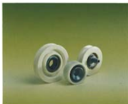
Olika utformning av innerringen för att erhålla fler funktioner. T. ex excentrisk, utvändigt gängad tapp för justering i höjled.