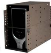
Artnr: 701 / 702