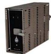
Artnr: 694 / 695

Tillval: 699 Mushylla (Terminal). 517-4 Kättinglås (Löst boxmontage). För likalåsning välj: 6942 / 6952.