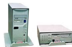
Artnr: 586 / 587

För alla Desktop och Tower-datorer på marknaden. Ett av Sveriges populäraste lås som skräddarsys efter varje dator för maximal säkerhet. Låset kan monteras såväl på som hängande under bord och levereras med godkända låscylindrar från ASSA (587) alt. originalcylinder från AnchorPad (586). Mycket enkel att montera och ger oförstörande installation. Förberett med uttag för våra kabel & vajerlås för skydd av skärm. 587-XXX Lågprofilås (ASSA-Cylinder). 586-XXX Lågprofilås (AnchorPad). XXX=Datorchassi (Modell/Storlek). Tillval: 532 Distansplatta (Max 45mm bordsram). 517-3 Likalås (ASSA). 517-2 H-Nyckelsystem (ASSA), 517-4 Likalås (Anchor).