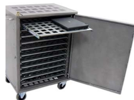
Artnr: 6283 / 6284 / 6285 / 6286

CEKA-AnchorPad:s unika lösning för säker förvaring och flyttning av Laptops, Stationära Datorer, Audio / Video-utrustning eller annan önskad utrustning mellan exempelvis klassrum, konferansrum, aulor m.m. Vår nya uppdaterade storsäljare till skolor för användning som mobilt klassrum. Vagnen har en säker och solid konstruktion är tillverkad i kraftig pulver-lackerad stålplåt. Dörren har ny 5 haks låsning och låses med 1st godkänd låscylinde från ASSA. Vagnen har 11 / 15 lätt utdragbara hyllor. De inbyggda nätuttagen möjliggör förvaring och laddning av upp till 22 / 30 st Laptops samtidigt. Väl tilltagna hål sörjer för god ventilation vid laddning. Finns även i version med Termostatstyrd fläkt (6285/6286) om man önskar ha datorerna i drift, exempelvis vid uppdateringar nattetid. Fästen för montering av nätverksswitch på valfri hylla, medföljer. Specialhjul gör vagnen lättmanövrerad . Som tillval kan vagnen kompletteras med tillbehör för att säkra utrustning på ovansidan av vagnen (skrivare, trådlös accesspunkt e.t.c.), tillbehör för förankring mot vägg eller kring annat fast föremål samt låsbar adapterlåda för förvaring av extra uppsättning nätadapterar. Mått utvändigt: 1125x790x580 mm(HxBxD). Tillval: 630 Förankringssats vägg, 631 Adapterlåda, 632 Monteringshylla ovansida vagn.