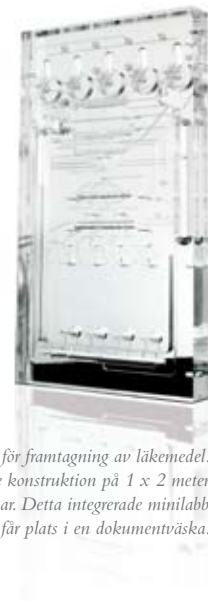
Bilden visar ett minilaboratorium för framtagning av läkemedel. Tidigare var detta en omfattande konstruktion på 1 x 2 meter med ledningar och kranar. Detta integrerade minilabb får plats i en dokumentväska.

Allt det vi levererar till dig – in i minsta detalj – är klassat och kan fås med ursprungscertifikat (SS-EN 10204), som gör det fullt spårbart i alla led. Du får med andra ord full trygghet på köpet!