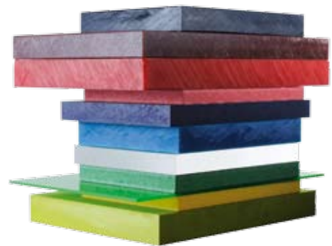
Våra plastmaterial finns i många olika kulörer.

På samma sätt kan du använda färgade plaster för att utmärka speciella vred och reglage.