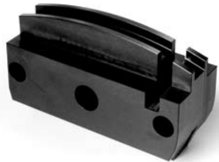
Denna detalj är gjord i UV-beständigt plastmaterial för att kunna användas i en steriliseringsprocess av livsmedel

Våra plaster används även som maskinelement (lager). Låg friktion, tyst gång och enkla att rengöra är andra fördelar.