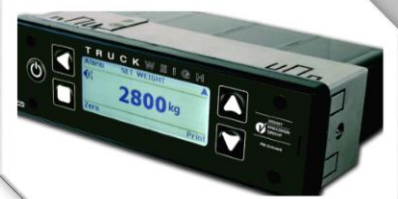
Våginstrument för radiouttag

Kungsvägen 66 • 195 70 Rosersberg Tel: +46 (0)763915520 • +46 (0)859035588 E-post: info@ajac.se • Web: www.ajac.se