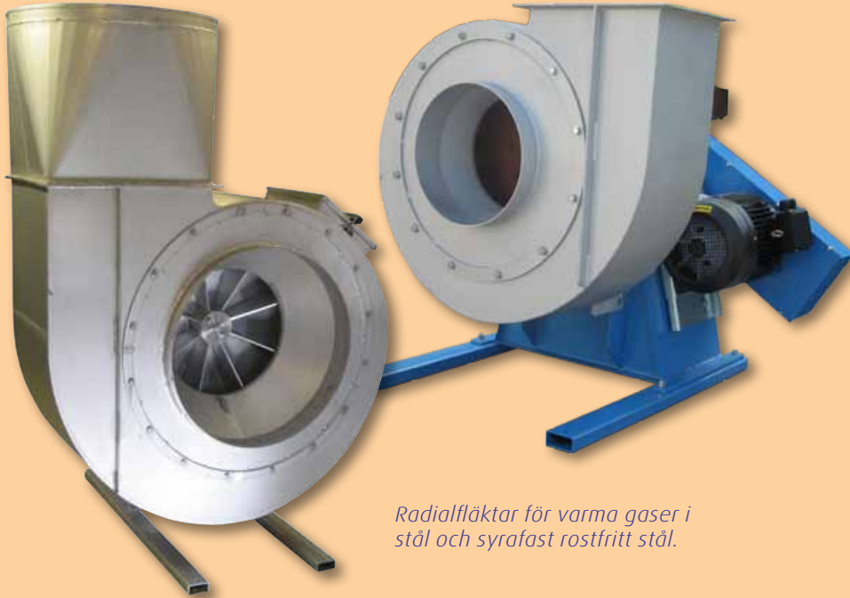
Radialfläktar för varma gaser i stål och syrafast rostfritt stål.