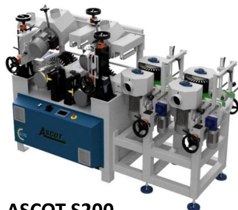
ASCOT S200 Listslipning