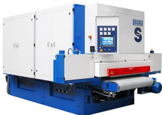
COSTA S-serien för finputsning av lack och faner.