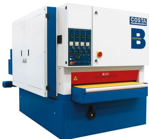
COSTA B-serien för strukturborstning