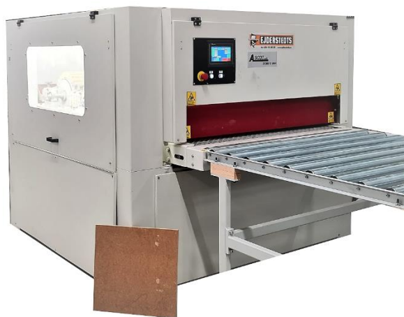
ASCOT S1300 Profilborstmaskin