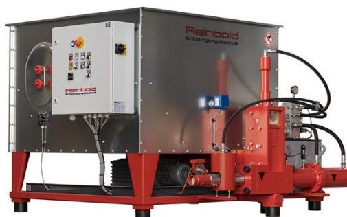
Avfallskvarnar & Brikettpressar