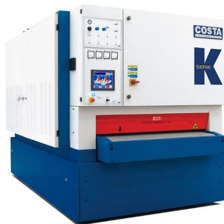
COSTA K-serien för kalibrering