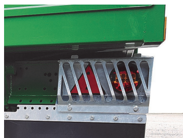
Kraftigt skydd för baklyktorna