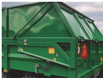
Hydraulisk baklucka. Passar alla modeller.