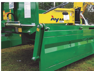
Hydrauliskt fällbar sida. Passar LD och LDH

För fler alternativ, ta kontakt med din säljare.