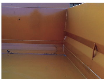
Rät vinkel mellan sida och botten