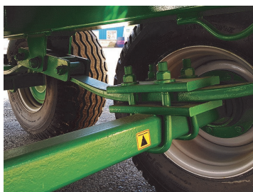
Fjädrande axlar för bästa körkomfort