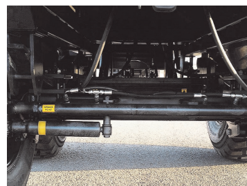
Medstyrande bakaxel. Passar DLH.