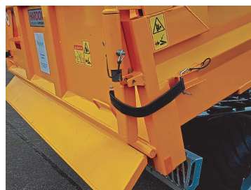
Låsning för spridarläm. Passar alla modeller.