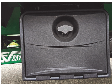
Verktygslåda. Passar alla modeller.