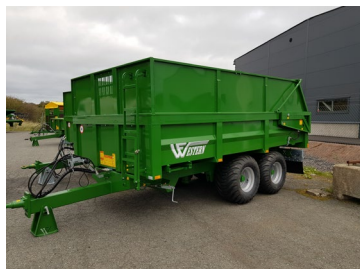
Förhöjningslämmar för spannmål och djupströbädd. Passar modeller från 10 ton