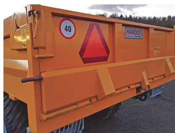
Topp- & sidohängd baklucka