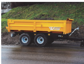
Framflyttade axlar. Passar LD och LDH