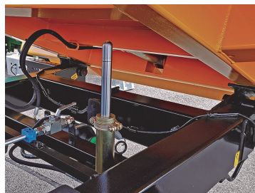
Hydraulisk schaktläm via enkelverkande uttag. Passar LD och LDH.