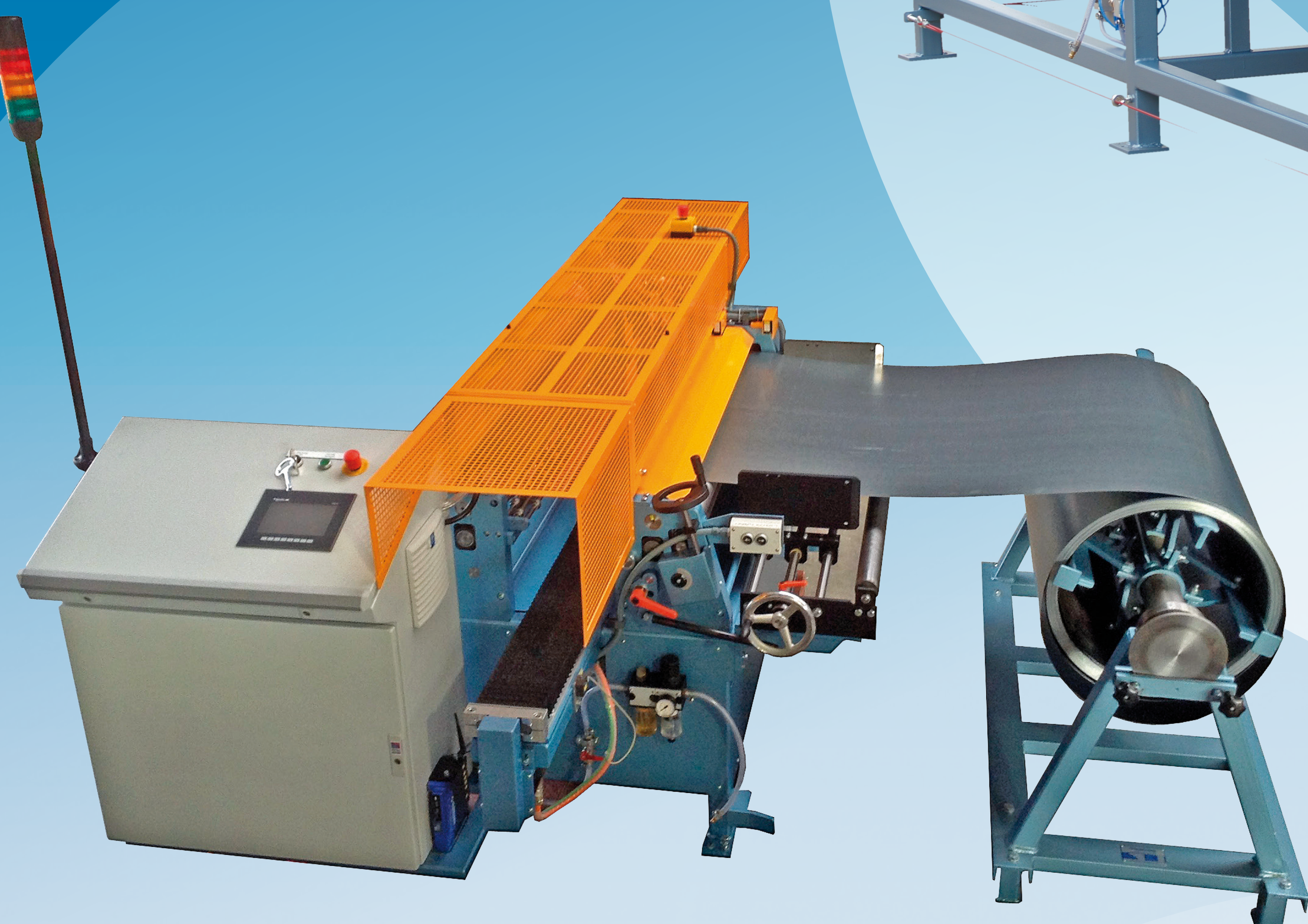
FLEX-CUT Multifunktionell klippsträcka