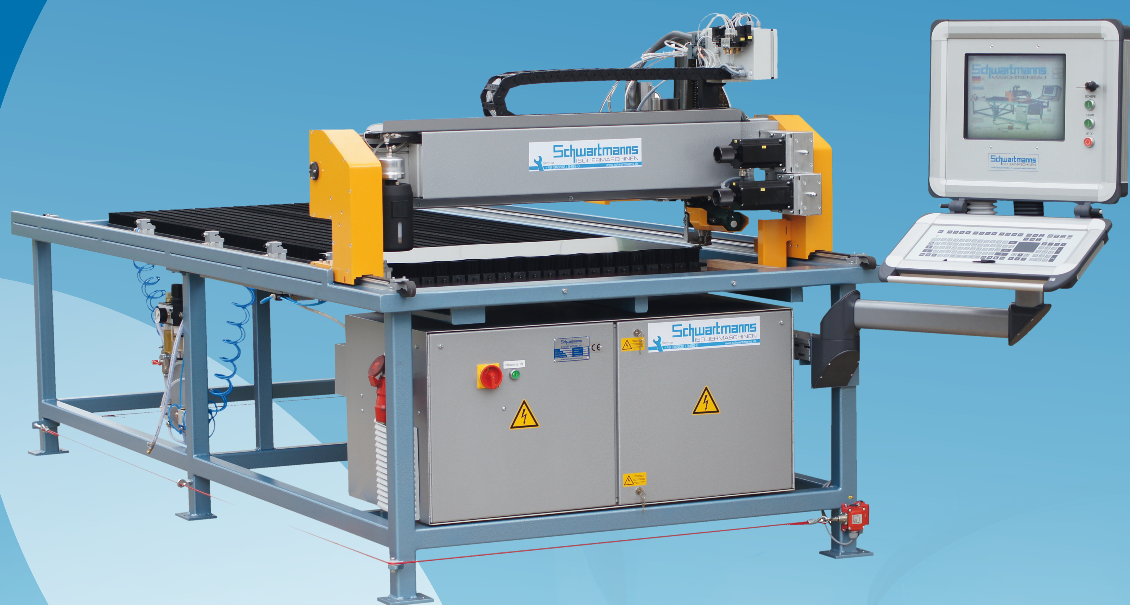
EFM-L Universiell skärmaskin