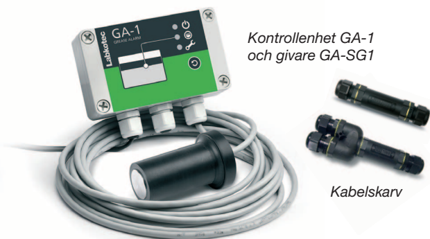
Kontrollenhet GA-1 och givare GA-SG1

GA-1 och GA-2 -larmanordningar är särskilt utformade för fettavskiljare. De anger när fettavskiljaren bör tömmas och förhindrar därmed skadliga fettutsläpp i avloppssystemet.