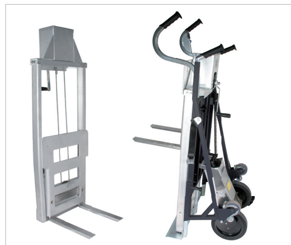
Vertikallyft Idealisk för t.ex. tillpassning och installation av spisar. Vertikallyften placeras enkelt på CargoMaster och därmed kan godset förflyttas upp och ner. Maximal lyftvikt 350 kg.

CE CargoMasters A-system motsvarar EG-direktivet 2006/42/EG för maskiner.