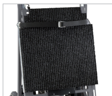
Bakvägg Skyddar lastgodset så att det inte glider eller repas.