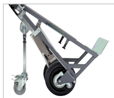
Transporthjul Med transporthjulet går lasten att utan större ansträngning skjuta fram på jämnt underlag.