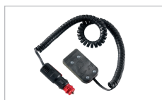
Billaddarkabel Finns som 12 V- eller 24 V-modell.