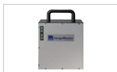
Batteripaket Extra batteripaket