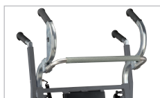
Stödbygel För transport av högt lastgods.