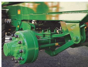
Fjädrande axlar för bästa körkomfort