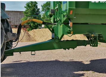
Fjädrande dragstång för bästa körkomfort