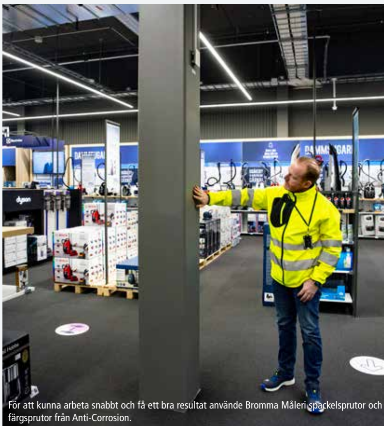
För att kunna arbeta snabbt och få ett bra resultat använde Bromma Måleri spackelsprutor och färgsprutor från Anti-Corrosion.