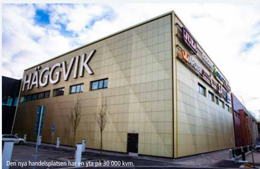
Den nya handelsplatsen har en yta på 30 000 kvm.