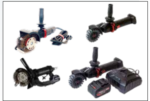
Bristle Blaster finns i olika utföranden, eldriven, batteridriven och luftdriven.

>> man är ett av de snabbast växande företagen i landet.