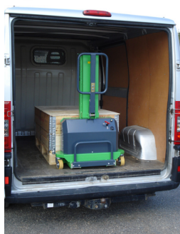
Och plötsligt! Allt i skåpet!