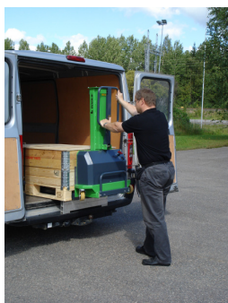
Tillbaks med stödbenen...