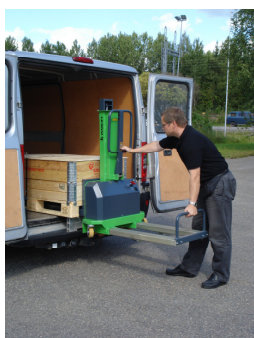
Den lyfter sig själv...