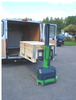
Den lyfter in pallen...