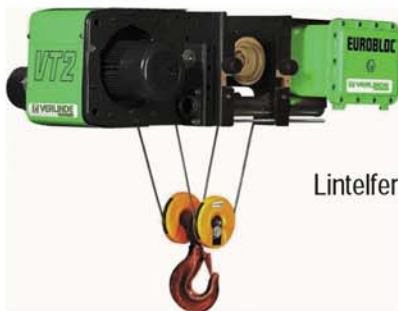
Lintelfern EUROBLOC VT