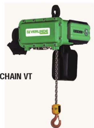
Kättingtelfern EUROCHAIN VT