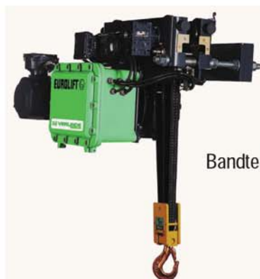
Bandtelfern EUROLIFT BH