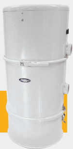
CE-1500 CS CE-1500 CS/PB

Premium CE 1500CS maskinerna med 15 liters uppsamlingsbehållare finns i 2 olika utföranden. Dels med cyklonavskiljning direkt till behållare (CE-1500CS) och när man av hygieniska eller praktiska skäl önskar ansluta 23 liters dammpåse (CE-1500CS/PB). Båda enheterna har s.k. by-pass motor för placering i ventilerade utrymmen och passar alla tänkbara hustyper och storlekar, och gärna där man önskar en hög placering av enheten då tömning sker under ifrån.