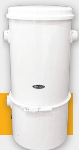
CE-1500 PB CE-1500 PB/TF

Premium CE1500PB maskiner med 23 liters uppsamlingspåse finns i 2 olika utföranden. Dels med s.k. by-pass motor (1500PB) som passar för placering i ventilerade utrymmen, och dels med s.k. Thru-Flow motor (CE-1500PB/TF) som kan placeras i slutet utrymme (ex. vis garderob) och kan förses med utblåsfilter för placering i lägenhet där möjlighet till avluft saknas. Båda typerna passar alla tänkbara hustyper och storlekar, och gärna där man önskar en låg placering av enheten då tömning sker uppifrån