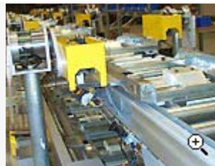
Monteringsfixturer och paletter för bilstolstillverkning