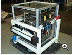
Utrustning för klippning av mönsterkort till mobiltelefonstillbehör.