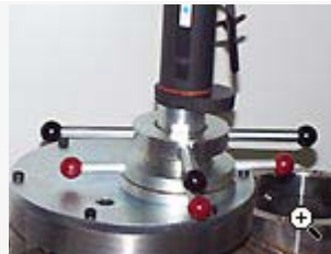
Rörfräsutrustning för ändplaning av rör inuti rör.