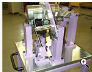
Kontrollfixtur för bilvärmare