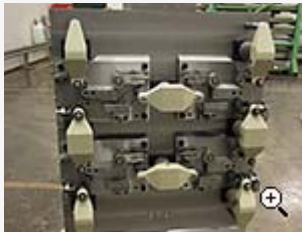
Bearbetningsfixtur för motordetaljer, hydraulisk fastspänning av arbetsstycken