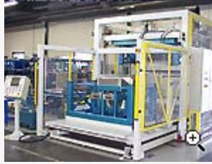
Hydraulisk stansmaskin för tredimensionell klippning (pneumatisk eller hydraulisk) av inredningsdetaljer till bilar.