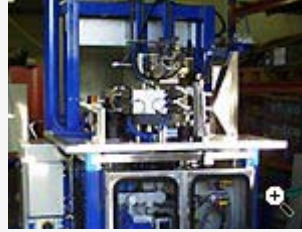
Rundbordsanläggning för elektrolytisk gradning av kamaxlar.