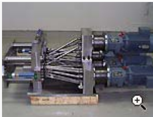
32-spindlig borrenhet för ståldetalj.