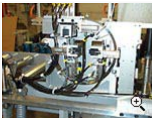
Manipulator för provning av manöverknappar på bilstol