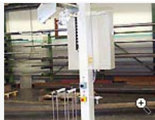
Utrustning för tapetsering av bilstol