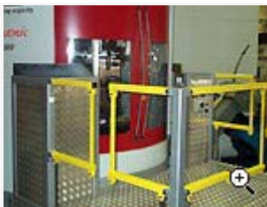
Arbetsplattform till bearbningsmaskin med programmerbar höj och sänkning