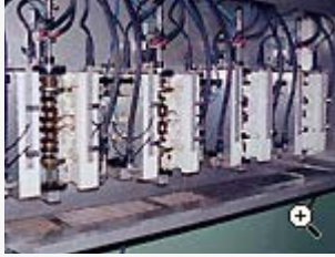
Urustning för elektrolytisk gradning av vevaxlar