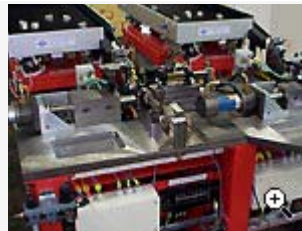
Utrustning för automatisk bussningsmontering i motordetaljer.