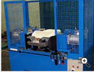
Stansutrustning för stansning av urtag i polyuretanskums detalj.