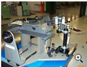
Monteringsfixtur för dragbalk till lastbilar