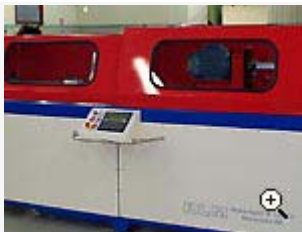
Specialtillverkad långhålsbormaskin för bormning av hål i motordetaljer.