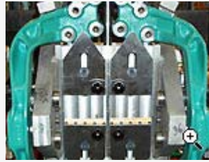
Bearbningsfixtur för chassiedetalj, hydraulisk fastspänning av arbetsstycken