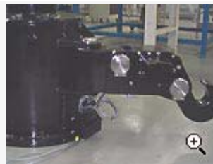
Pollare med motoriserad frikoppling av tross vid slussning.