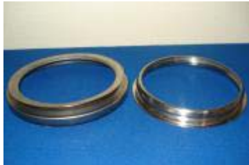
In- och Utkragade ringar \varnothing 195 mm av rostfritt stål