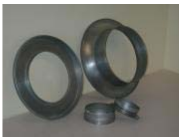
Urval av ventilationsdetaljer.