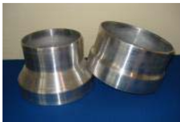
In- och utkragad detalj \varnothing 140/190 mm, trycksvarvad från plan 4 mm aluminiumplåt