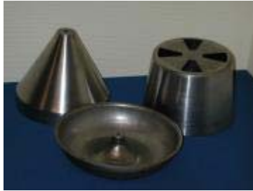
Trycksvarvning resp. dragpressning av grövre dimensioner i bl.a. rostfritt.