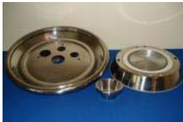
Trycksvarvade och pressade belysningsdetaljer till swimmingpooler \varnothing 321 resp. 200 mm, av 1,5 mm rostfritt stål