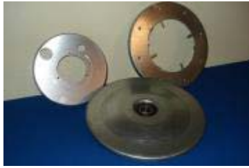
Detalj av aluminiumplåt trycksvarvad och pressad. Samt kurvhjul \varnothing 250 mm, av 2 mm galvplåt med monterat och kalibrerat kullager