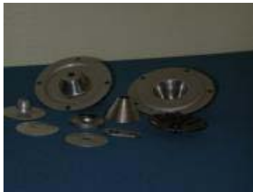
Pressade detaljer, även i bandmaterial samt kombination pressning/trycksvarvning.