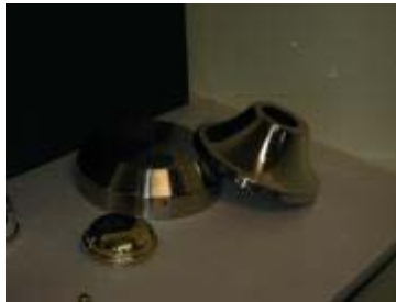
Inredningsdetaljer av rostfritt samt mässing.