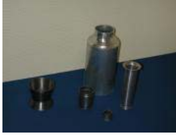
Rörämnena krympta resp. vidgade.