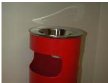
Trycksvarvad kopp av rostfritt stål Ø 260 mm till papperskorg i plast