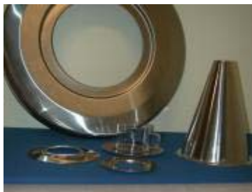
Dragpressad detalj Ø 550 mm av 1,25 mm rostfritt, trycksvarvad kon samt husgeråd (rostfritt fat design Boda Nova).