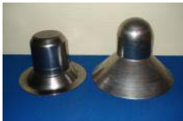
Trycksvarvade detaljer av 2 mm järnplåt \varnothing 200 resp 250 mm