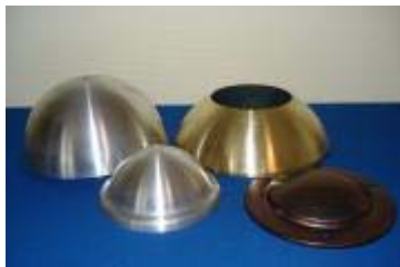
Trycksvarvade halvklot/sfärer av aluminium, mässing och järnplåt