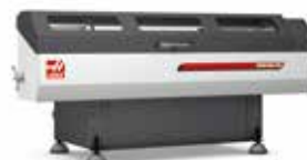
TILLBEHÖR KORTSTÅNGSMAGASIN ETC.