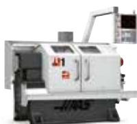
TOOLROOM SVARVAR 6 MODELLER