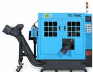
KLINGSÅG TC-75 NC