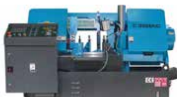
BANDSÅG C-3028 NC