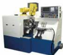
HORISONTELL SVARV 2-SPINDLIG 2SI-6, 2SI-8, 2SI-10