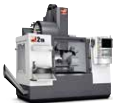
VERTIKALA FLEROPERATIONSMASKINER 46 MODELLER