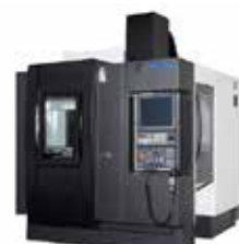
VERTIKAL 3-AXLIG MYCENTER-3XGSP