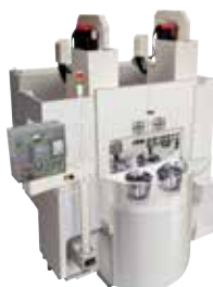
VERTIKAL SVARV 4-SPINDLIG VT4 350