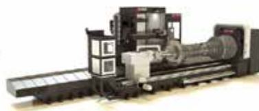
MULTIPROCESSMASKIN SVARVNING, FRÄSNING, SLILOPTIMERING