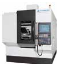
VERTIKAL 5-AXLIG MYTRUNNION-4G