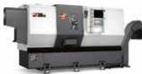
CNC SVARVAR 16 MODELLER