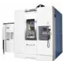
VERTIKAL 5-AXLIG MYTRUNNION-1