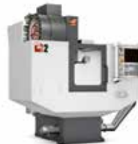
MINI MILLS 5 MODELLER