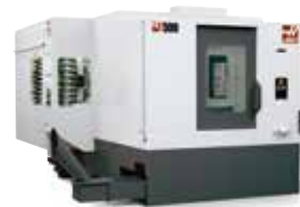
HORISONTELLA FLEROPERATIONSMASKINER 12 MODELLER