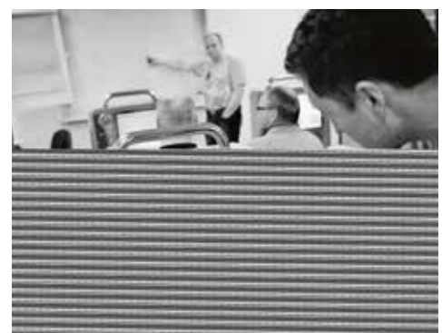
Haas technical Education Center hittar ni i Edströms lokaler.