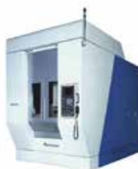
VERTIKAL 5-AXLIG MYTRUNNION-5