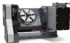
RUNDMATNINGSBORD 36 MODELLER