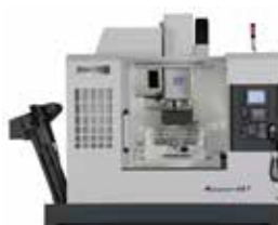
VERTIKAL 5-AXLIG MYCENTER-4XT