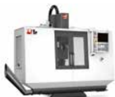
TOOLROOM FRÄS-/ FLEROPERATIONSMASKINER 6 MODELLER