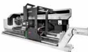
FLATBÄDDSSVARV GT7 G2/G4