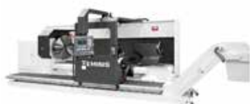
FLATBÄDDSSVARV GT5 G2/G4