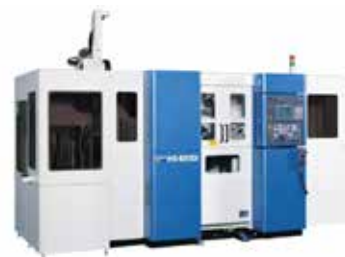
HORISONTELL SVARV 4-SPINDLIG HS 4200i