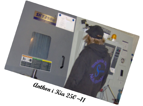
Antlan i Kia 250-11