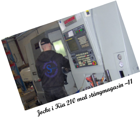
Jacke i Kia 210 med stängmagasin -11