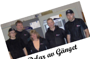
Delar av Gänget