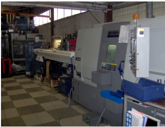
Kia 150 med stängmagasin -10