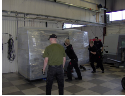
Nyaste Kia 210 på Plats Aug -11