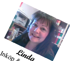
Linda Inköp & Ekonomi

Astravägen 3 • 862 32 KVISSLEBY • Tel Växel: +46 (0)60-56 23 20 www.svartviks-svarvteknik.se